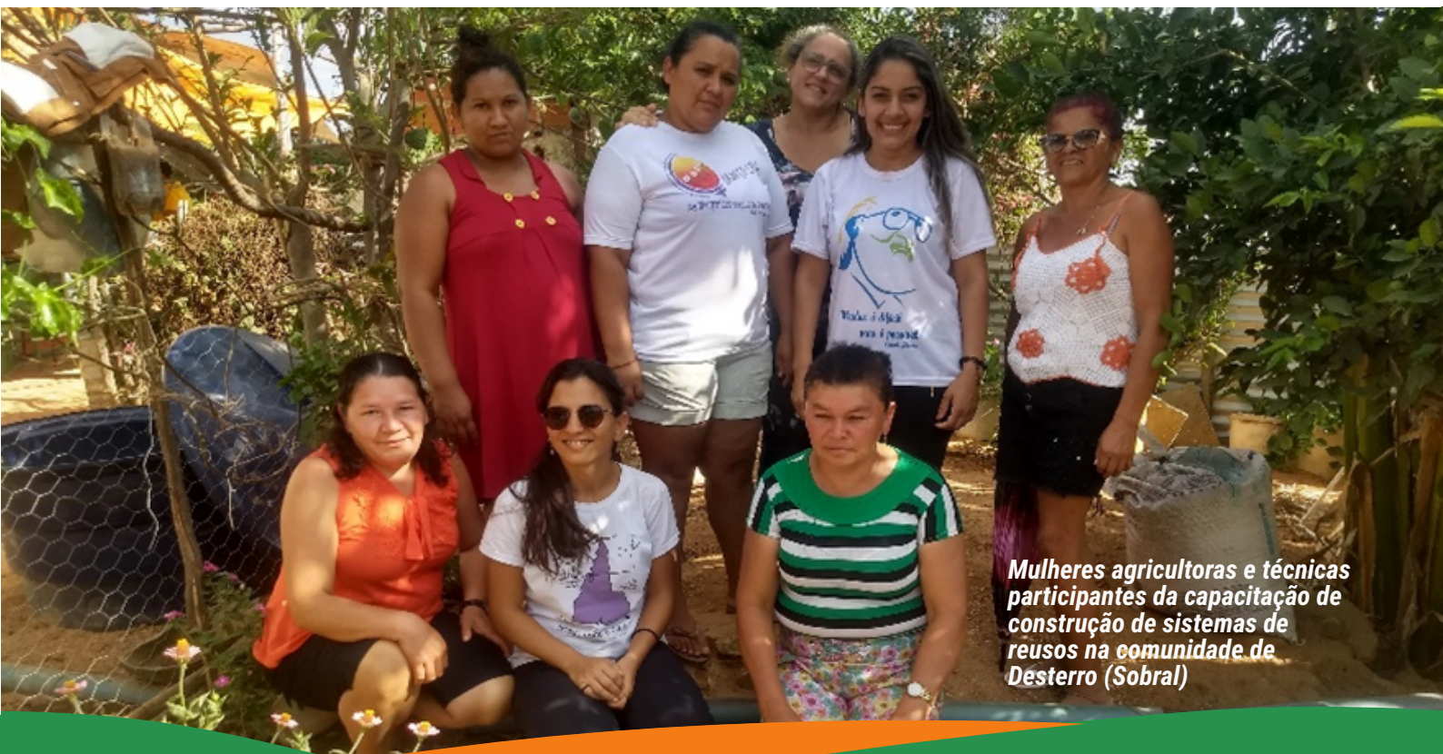
Mulheres agricultoras e técnicas participantes da capacitação de construção de sistemas de reusos na comunidade de Desterro (Sobral)

No mês de maio de 2019, o Centro de Estudos do Trabalho e Assessoria ao Trabalhador – CETRA, uma das entidades executoras do Projeto Paulo Freire (PPF) no território de Sobral, promoveu um curso de capacitação para mulheres pedreiras, onde elas se especializaram na construção de sistemas de reuso de águas. Esta iniciativa vem contribuindo para dar visibilidade, gerar reflexões e desconstruir o que chamamos de estereótipos de gênero, que se configuram como crenças naturalizadas sobre as características e o comportamento de mulheres e homens.